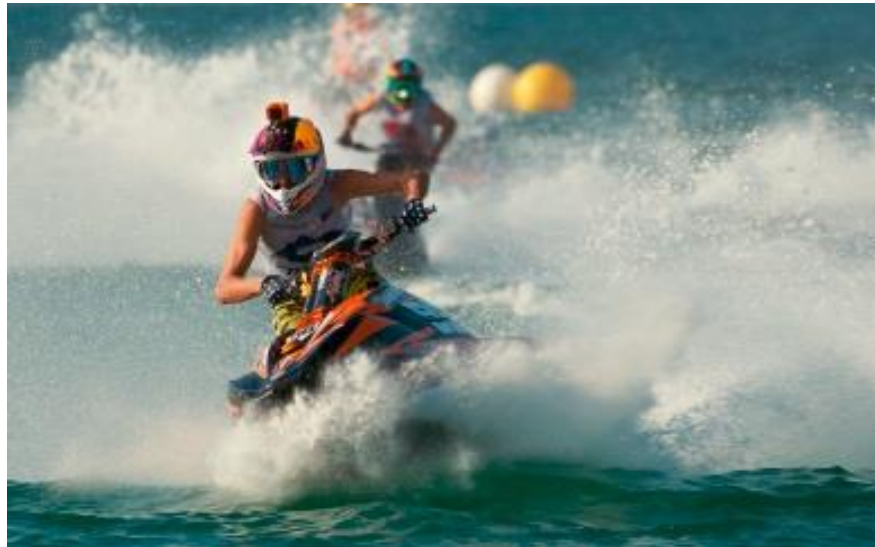
I m.,złoty medal w konkursie fotograficznym UIM 2017 r. w kat. „Skutery Wodne” (2017 UIM Photo Competition – Aquabike Category)- foto z III rundy Mistrzostw Świata UIM w Dubaju – 24.11.2017 r.